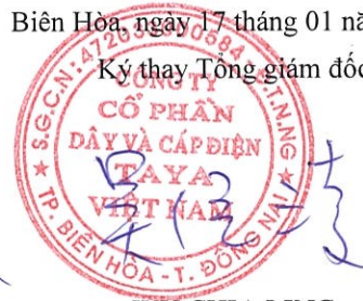
WU CHIA LING